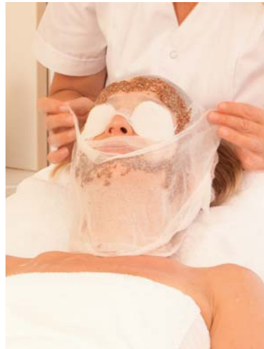
„Natur pur“ – natürliche Pflege mit Leinsamen in Kombination mit „MeineBase“.